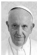
El Papa Francisco.