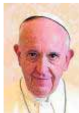
El papa Francisco.